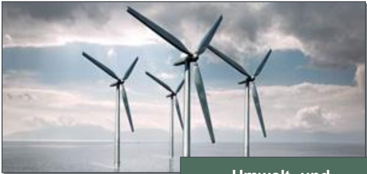
Umwelt- und Klimaschutz